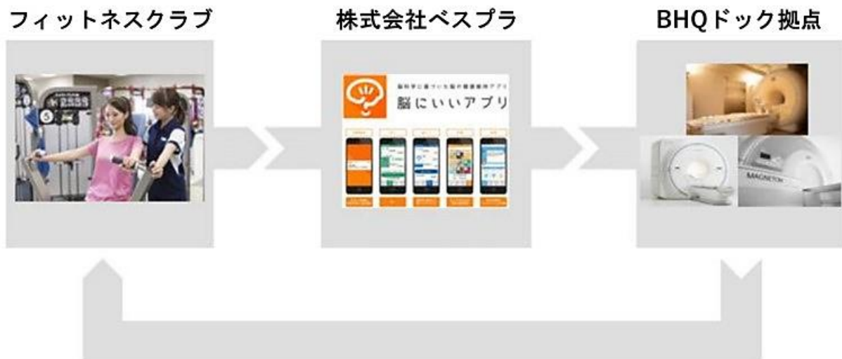
図3 フィットネスと脳の健康に関する研究における導入事例