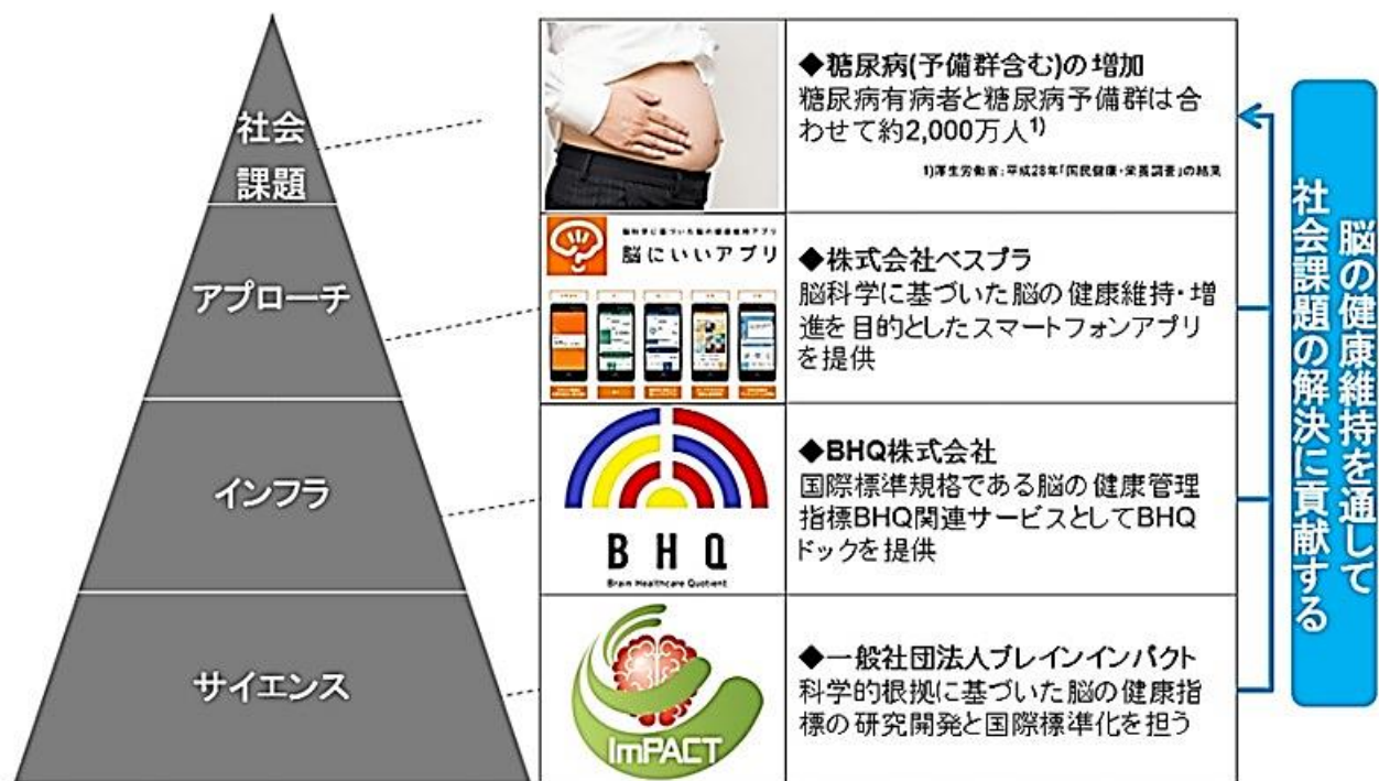
図2 糖尿病と脳の健康に関する研究における導入事例

本研究は、糖尿病予備群における脳の健康を維持・増進するために必要な要素を明らかにし、患者エンパワーメント 4 に貢献することを目指すものである。また、これらの基礎研究と並行して、糖尿病ならびに認知症にも予防効果があるとされる「運動」について、実フィールドにおける応用研究を実施する。