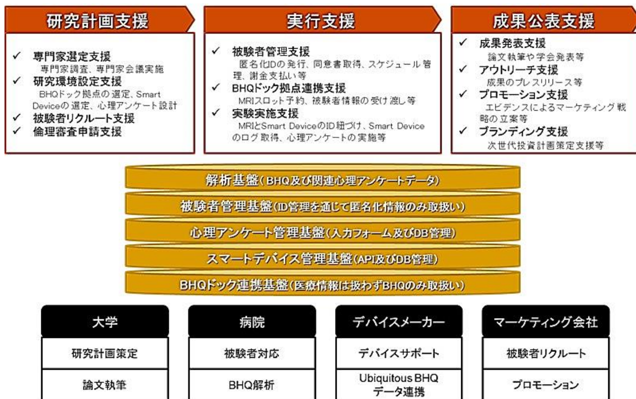
図1 研究プラットフォームのデザイン

論文執筆や学会発表等の「成果発表支援」、成果のプレスリリース等を実施する際の「アウトリーチ支援」、エビデンスによるマーケティング戦略の立案等を行う「プロモーション支援」、次世代投資計画の策定等を支援する「ブランディング支援」等の支援を実施する。